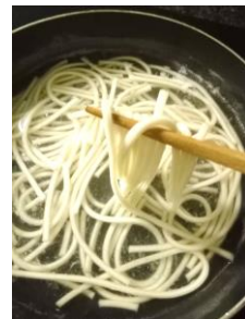
AIヌードル 販売・売上推移